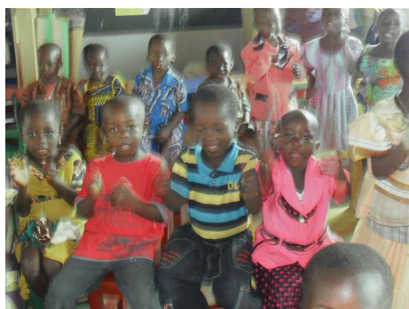
festa alla scuola

In gennaio, poiché i piccoli aumentano di anno in anno, l'Associazione Epsilon, che già ci assicura un abbondante pasto al giorno, il Gruppo Kos e la classe EMBA 2013, ci aiuteranno ad ampliare la scuola materna: GRAZIE Epsilon e Sponsor!!!